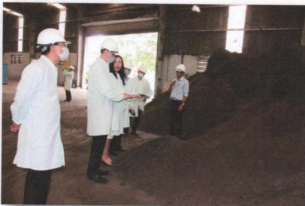
Hình 6: Khu vực chứa mùn compost sau xử lý tại Trạm xử lý tái chế làm mùn compost

b) Tỷ lệ phần trăm chất thải được tái chế để sản xuất mùn compost của Công ty SDV là ~3,45%.