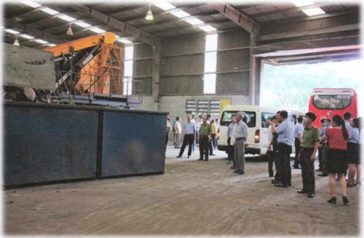
Hình 3: Trạm tái chế chất thải làm mùn compost