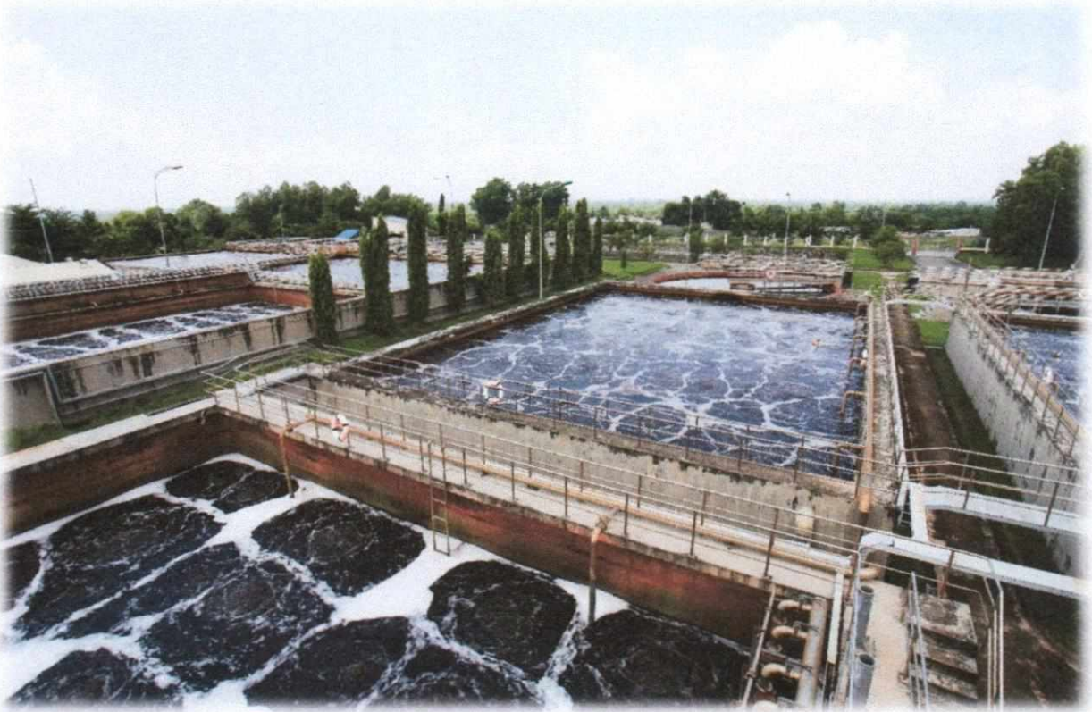
Hình 2: Nhà máy xử lý nước thải tập trung