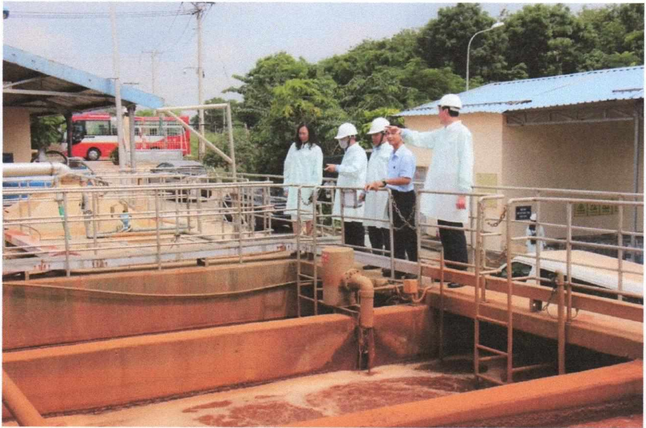
Hình 4: Đoàn giám sát tham quan trạm xử lý nước thải tại Khu XLCT Quang Trung