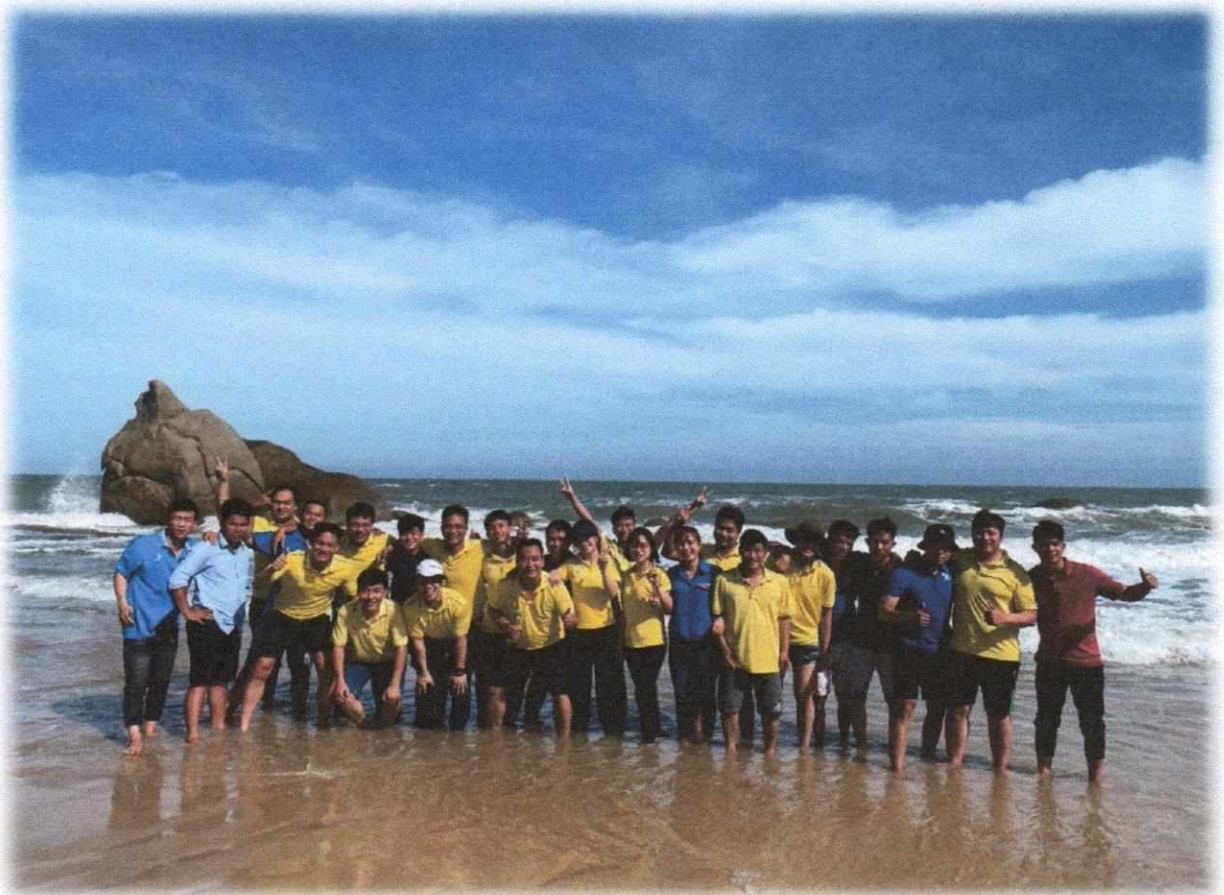
Hình 5: Cán bộ công nhân viên tham quan du lịch

Trong năm 2020, Công ty đã tổ chức cho cán bộ nhân viên đi tham quan, du lịch với tổng số tiền đã chi 1,8 tỷ đồng; trang bị đồng phục cho cán bộ nhân viên với số tiền là 661,1 triệu đồng.