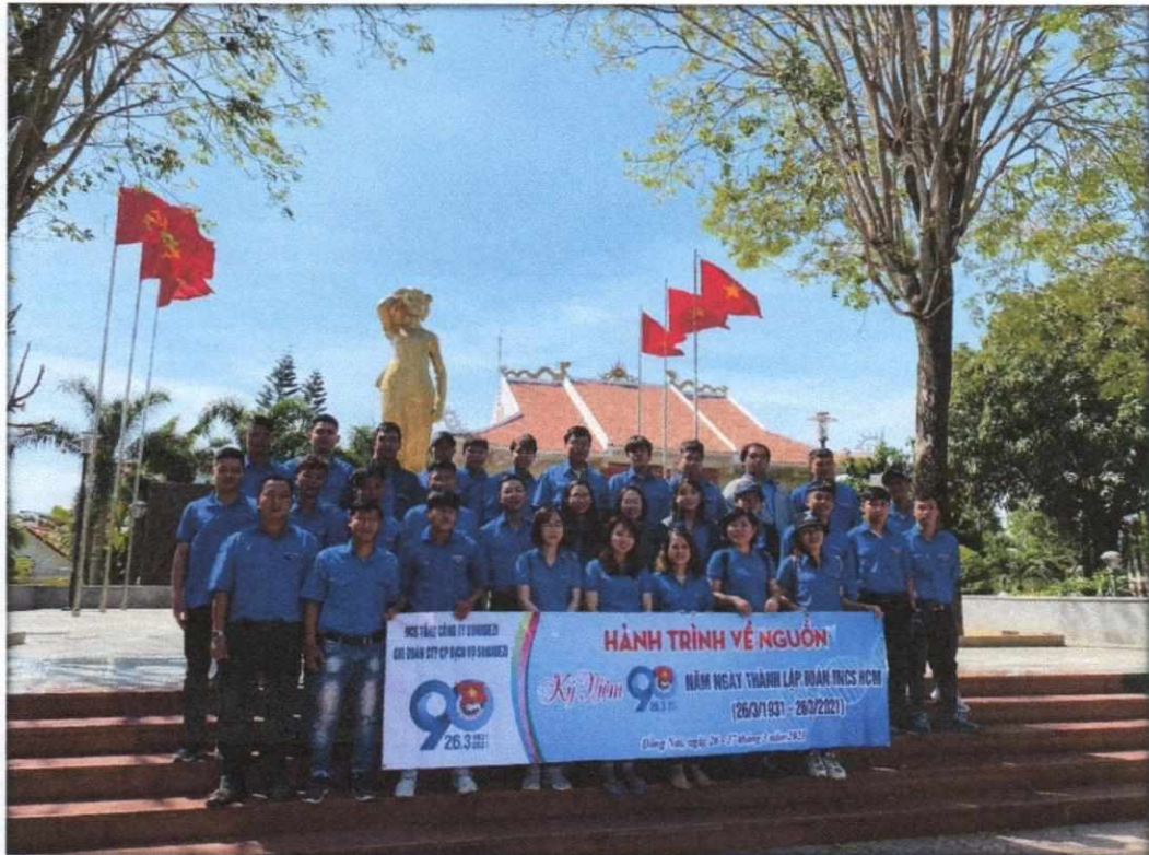
Hình 1: Chi Đoàn Thanh niên công ty CP Dịch vụ Sonadezi